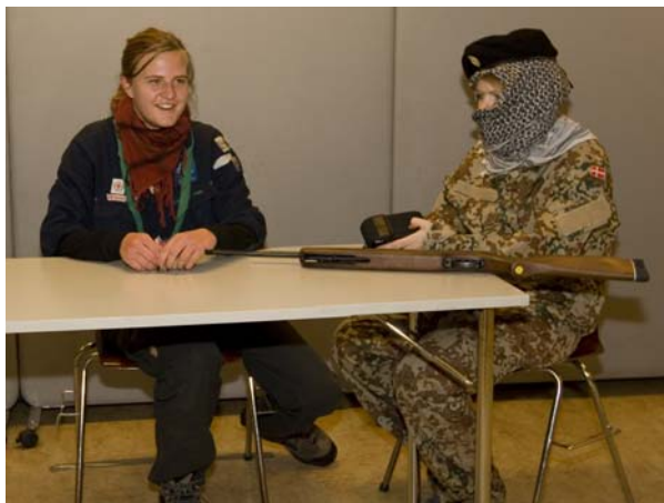
Billede fra troppenes juletur i november.

Bardunen ønsker alle en rigtig glædelig jul og et godt nytår!