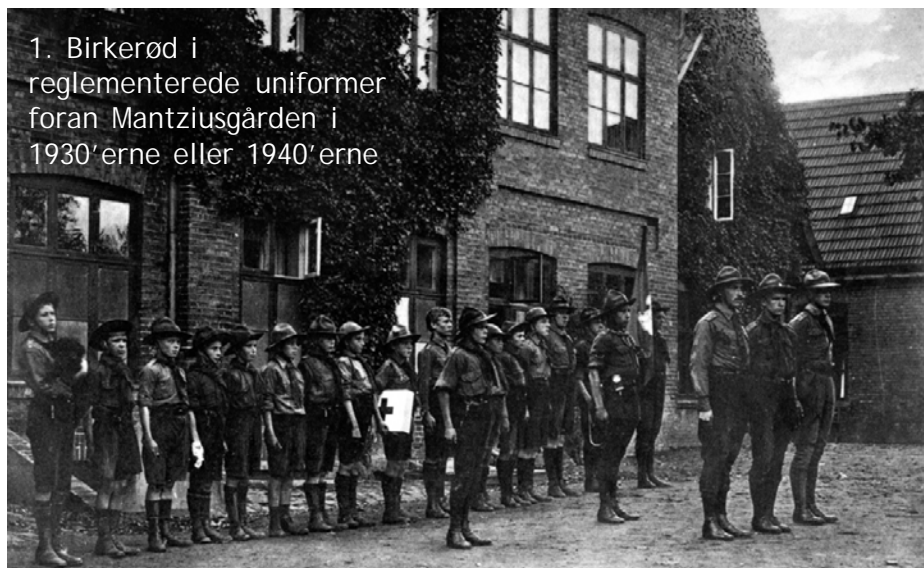
1. Birkerød i reglementerede uniformer foran Mantziusgården i 1930'erne eller 1940'erne