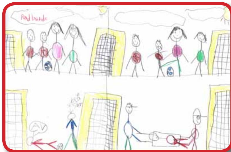
Rød bande viser, hvordan en blå spejder hjælper en fodboldspiller, der er kommet til skade.