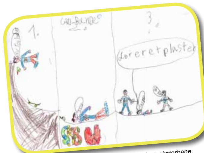
Gul bande har tegnet hvor galt det kan gå på en skaterbane. Straks efter kommer et par spejdere og yder førstehjælp.

Den 22. februar er en særlig dag for spejdere i hele verden. Spejderbevægelsens stifter, Robert Baden-Powell og hans kone Olave var begge født den dag, og spejdere fra hele