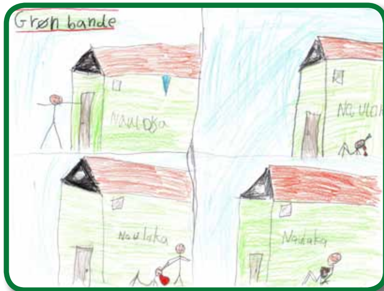
Grøn bandes tegning foregår i Naulakha, hvor en spejder får næseblod og en anden spejder straks hjælper.