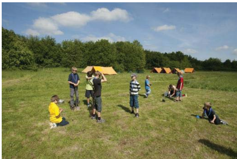
Lejrindretning i fuld gang - Vindinge 2011

Vi planlægger ikke at have en besøgsdag som sådan, men alle er velkomne til at besøge os. Dage mærket med ☀ er de bedste, men kontakt os for nærmere oplysninger.